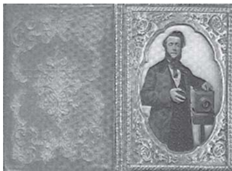
Figura 4 - Estojo daguerreótipo, auto-retrato com câmera

Com o passar do tempo, os equipamentos foram se tornando cada vez mais portáteis; o fotógrafo e a sua máquina daguerreótipo (Figura 4), com acessórios como objetivas para paisagens e retratos, podiam oferecer numerosos outros serviços, da simples chapa de vidro até medalhas, retratos em miniatura, entre outros. Graças ao baixo custo de produção, que resultava em preços mais acessíveis ao cliente, a fotografia ganhou uma enorme popularidade.