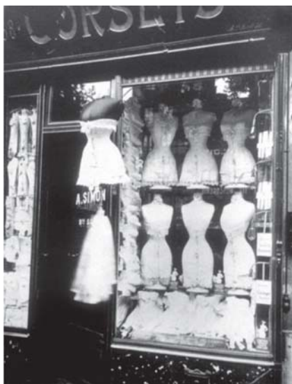
Figura 9 - Boulevard de Strasbourg, 1912 Livro: Atget's Paris, Editora Taschen, 2001

Voltando a Atget, suas fotografias foram o ponto de ruptura e de passagem entre uma época de decadência e um renascimento. Ele “desinfeta a atmosfera sufocante difundida pela indústria fotográfica dos retratos”. (CHAVES, 2001, p.428). Seu trabalho demonstra uma preocupação em purificar a imagem, libertando o objeto de sua aura, recusando o exótico, o majestoso e o romântico (Figura 9).