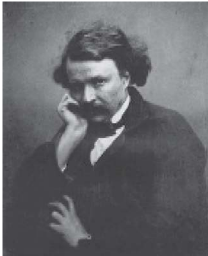
Figura 6 - Auto-retrato de Nadar

Quem iria perder tempo em desenhar, gravar, se a máquina fazia melhor e mais rápido? Houve mesmo quem afirmasse que a fotografia era a pá de cal sobre o cadáver das artes gráficas, tão incômodo como o de Ionesco. Um corpo sem vida que não pára de crescer, ocupar espaço e perturbar. (VON SCHMIDT, 1987, p.67).