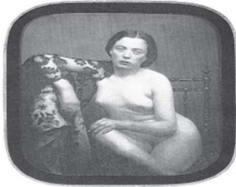
Figura 5 - Daguerreótipo erótico

A fotografia teve, ainda, seu papel como responsável por novos gêneros de aquisição de imagens. O valor de documentário da fotografia serviu, por exemplo, como fonte iconográfica para os estudos históricos das manifestações ocorridas fora do estúdio. Registraram-se novas paisagens, retratando diferentes tipos humanos, participando de expedição comercial, científica e de atividades militares, até o momento em que a imagem fotográfica, tida como registro visual da realidade, passou a ser multiplicada pela reprodução gráfica, tornando-se portadora de notícia e de informação, incorporando-se como suporte da imprensa escrita.