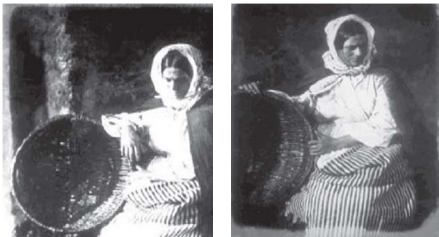
Figuras 7 e 8 - Vendedores de peixe

Benjamin estabeleceu uma diferença entre duas formas de ser retratado fotograficamente: “retratos de pessoas”, imagens que se perdem com o passar dos tempos; e “imagens de pessoas anônimas”, aquelas que contemplam alguma coisa (CHAVES, 2001, p. 424). É este o elemento diferenciador nas imagens: o olhar do retratado na vendedora de peixes (Figuras 7 e 8), passando uma sensação de plenitude e segurança, ainda encoberta visivelmente pela aura.