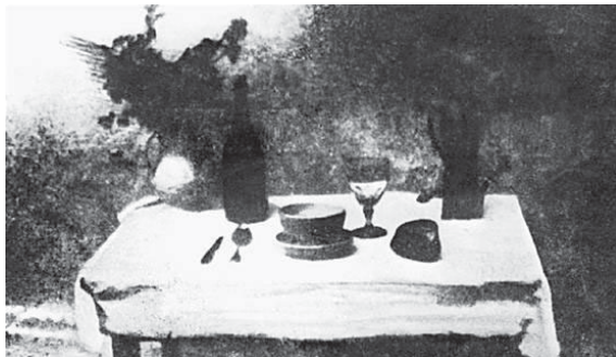
Figura 2 - A mesa posta