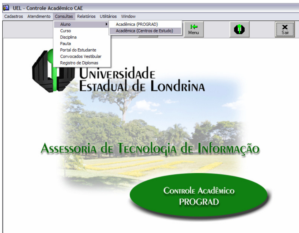
Figura 1 – Menu de Consultas do Sistema Acadêmico