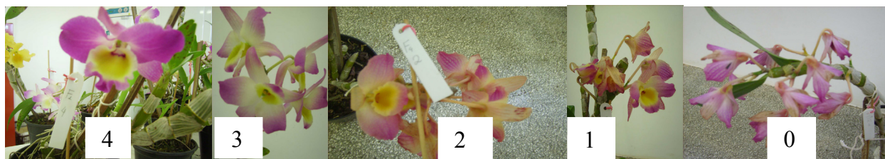
Figura 1. Critério de notas utilizadas para avaliação da qualidade estética das flores de Dendrobium nobile .

Nota 4 – flor com características perfeitas para comercialização, túrgida, vistosa e sem manchas.