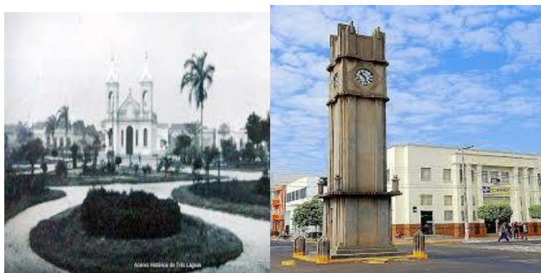
Figura 1 – Relógio Central