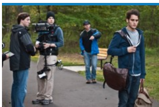
(/sites/default/files/gn/12/12/foto28cul-404-capa-d4.jpg)Filmagem de "Três Histórias, um Destino": produção inspirada em livro de missionário foi vista por 226 mil espectadores, com arrecadação de R$ 1,9 milhão

O acirramento da concorrência pode alçar a indústria da salvação a um novo patamar mercadológico. A Geo, plataforma de eventos da Rede Globo, vai ocupar 10 mil m 2 do ExpoCenter Norte, em São Paulo, de 17 a 20 de junho, com a primeira Feira Internacional Cristã (FIC). A meta é atrair 200 mil visitantes em torno da produção de gravadoras e editoras evangélicas e de fabricantes de moda e brinquedos especialmente criados para o público religioso. Até agora esse consumidor tinha a ExpoCristã, a maior feira religiosa de negócios da América Latina, que em setembro levou mais de 160 mil pessoas ao Centro de Exposições do Anhembi, também em São Paulo, e movimentou R$ 100 milhões nos sete dias do evento. A FIC pode abocanhar também uma fatia da Feira Literária Internacional Cristã (Flic), promovida pela Associação dos Editores Cristãos do Brasil (Asec), que em sua primeira edição, de 3 a 6 de maio, atraiu cinco mil visitantes ao Espaço de Eventos São Luiz, em São Paulo.