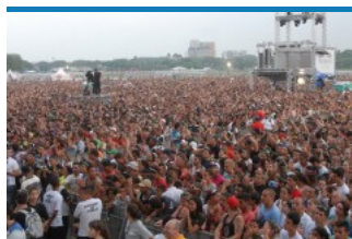
(/sites/default/files/gn/12/12/foto28cul-406-capa-d4.jpg)O Festival Promessas reuniu 100 mil pessoas em São Paulo: transmitido pela Globo, evento com expoentes da música evangélica foi um dos trunfos de sua programação de fim de ano

Os especialistas concordam que o avanço evangélico foi o estopim, nos anos 1990, para a reação carismática. A partir daí a Igreja Católica também começou a produzir estrelas de massa de aparência impecável e talento de comunicador. Os espíritas, que têm presença histórica nas telenovelas e mais recentemente no cinema, por causa da força da reencarnação no inconsciente coletivo brasileiro, mantiveram distância da disputa. Mas, assim como católicos e evangélicos, também aproveitaram o público cativo para buscar a inserção em outros nichos de mercado, como a autoajuda. A qualidade estética do produto religioso evoluiu com a incorporação em escala ao mercado de consumo, mas o processo, dizem os críticos, nem sempre foi acompanhado da sofisticação no conteúdo do produto