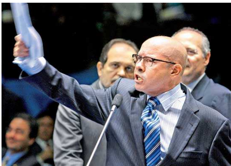
Figura 6: Folha de São Paulo 28/03/12 (Sérgio Lima)

O senador sério, até então, pela fotografia, sem margem para muita interpretação de sua personalidade, ressurgiu nas fotografias do jornal Folha de São Paulo em 28 de março, sob a manchete: “PSOL protocola representação contra Demóstenes no Senado”.