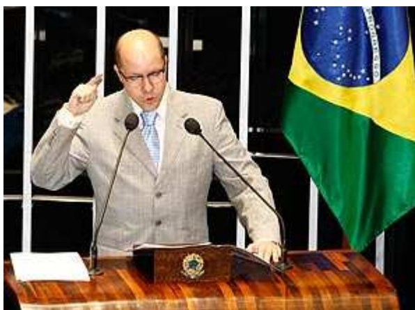
Figura 10: Folha de São Paulo 03/04/12 e 04/04/12 (Lula Marques)

Em 3 de abril, a crise se agrava e a Folha noticia que o senador vai pedir desfiliação do Democratas. Na matéria “Demóstenes Torres vai pedir desfiliação do DEM”, a foto de Lula Marques é datada de 6 de março. Nesse dia, o senador usou a Tribuna da Casa somente uma vez, quando fez sua primeira aparição e defesa pública após as denúncias de seu envolvimento com Carlos Cachoeira. Em 4 de abril, novamente nos deparamos com a mesma fotografia ilustra a matéria “Leitor diz que caso Demóstenes Torres ilustra situação do Brasil”.