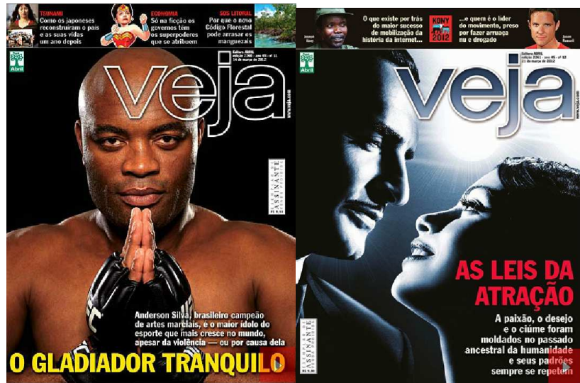
Figura 3: Capa da Revista Veja 14/03/12 Figura 4: Capa da Revista Veja 21/03/12

É no dia 27 de março que a crise política toma proporção e o DEM manifesta-se pela primeira vez cogitando a expulsão do senador goiano, que até 2011, era um nome estratégico no partido. A Folha de São Paulo noticia: “DEM já estuda possibilidade de expulsar Demóstenes”. A primeira imagem fotográfica é utilizada. Uma fotografia do banco de imagens do STF, datada de 3 de março, com uma legenda identificatória: “O senador Demóstenes Torres”.