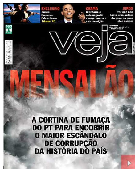
Figura 12: Capa da Revista Veja 18/04/12

Somente no dia 18 de abril então, a Revista Veja admite que há uma crise no Congresso, porém, sem mencionar claramente que o maior envolvido é Carlos Cachoeira. A Revista informa que há um “mensalão” dentro das principais bases do PT.