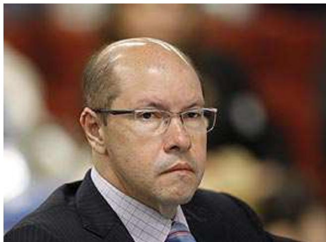
Figura 5: Folha de São Paulo 27/03/12 (Nelson Jr.)

É no dia 27 de março que a crise política toma proporção e o DEM manifesta-se pela primeira vez cogitando a expulsão do senador goiano, que até 2011, era um nome estratégico no partido. A Folha de São Paulo noticia: “DEM já estuda possibilidade de expulsar Demóstenes”. A primeira imagem fotográfica é utilizada. Uma fotografia do banco de imagens do STF, datada de 3 de março, com uma legenda identificatória: “O senador Demóstenes Torres”.