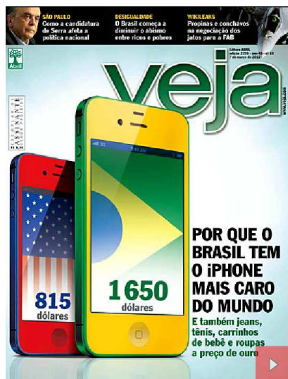
Figura 2: Capa da Revista Veja 07/03/2012

A Revista Veja tem sua edição do dia 7 de março com os destaques: “Por que o Brasil tem o Iphone mais caro do mundo”, como título de capa.