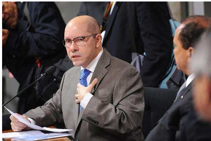
Figura 11: Folha de São Paulo 12/04/12

publicada às 11:57h, está sob o título “Petista Humberto Costa vai relatar processo contra Demóstenes” .