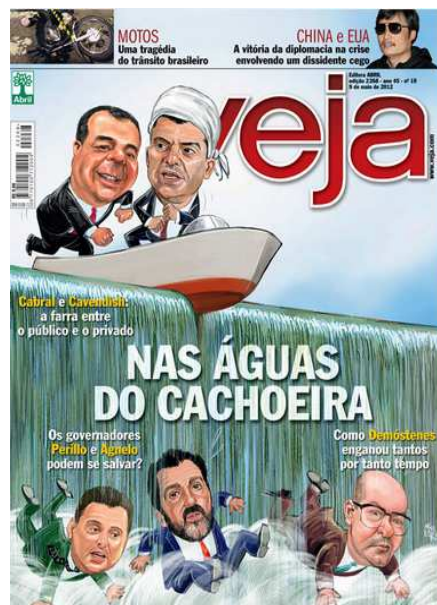
Figura 15: Capa da Revista Veja 07/05/12

Em 5 de maio, a crise política tem destaque na revista britânica The Economist . Então, somente no dia 7 de maio, a Revista Veja assume a crise envolvendo o nome do bicheiro Carlos Cachoeira e trata o assunto como manchete de capa.