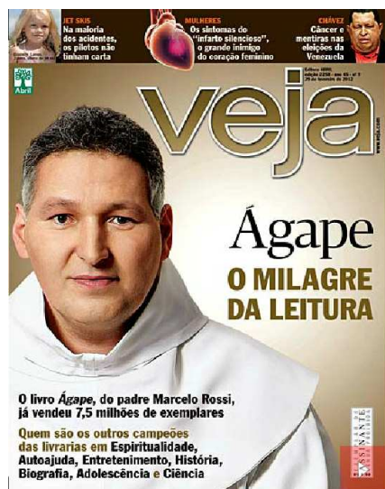
Figura 1: Capa da Revista Veja 29/02/12

No dia 29 de fevereiro, dia da deflagração da Operação Monte Carlo, a edição da Revista Veja deu amplo destaque ao Padre Marcelo Rossi, com a capa: “Ágape: o milagre da leitura”. Nem mesmo uma nota nas páginas da coluna Radar sobre a Operação foi escrita.