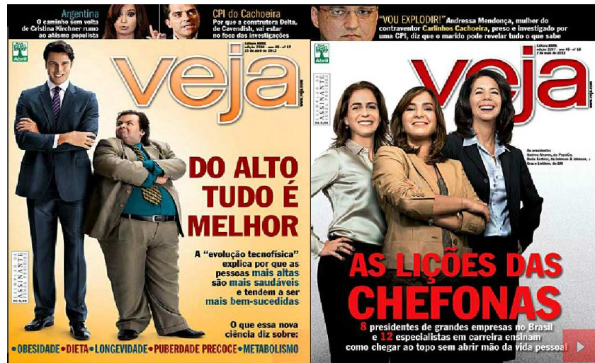
Figura 13: Capa da Revista Veja 25/04/12 Figura 14: Capa da Revista Veja 02/05/12

Em 5 de maio, a crise política tem destaque na revista britânica The Economist . Então, somente no dia 7 de maio, a Revista Veja assume a crise envolvendo o nome do bicheiro Carlos Cachoeira e trata o assunto como manchete de capa.