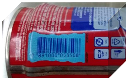
Figura 2 – Código de barras lineares

O QR Code (Figura 3) é um código de barras bidimensional, criado em 1994 pela empresa japonesa Denso Wave, pertencente ao grupo Toyota fabricante mundial de equipamentos automotivos. Seu objetivo era rastrear o estoque das peças fabricadas e para isso o código permitia decodificar seu conteúdo em alta velocidade por um equipamento de leitura. Na tradução para o português Quick Response significa “Resposta Rápida”.