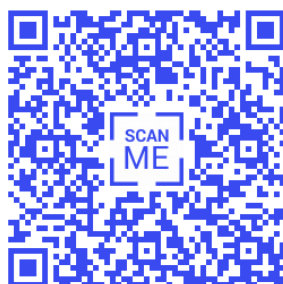
Figura 5 – QR Code personalizado

Algumas plataformas oferecem maior liberdade e criatividade, oferecendo inúmeras possibilidades de personalização: cores, estilos e até a inserção de logotipos de empresas ou marcas no centro dos códigos (Figura 5).