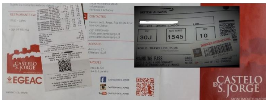
Figura 4 – QR Code em diversos setores