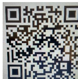
Figura 3 – Código de QR Code