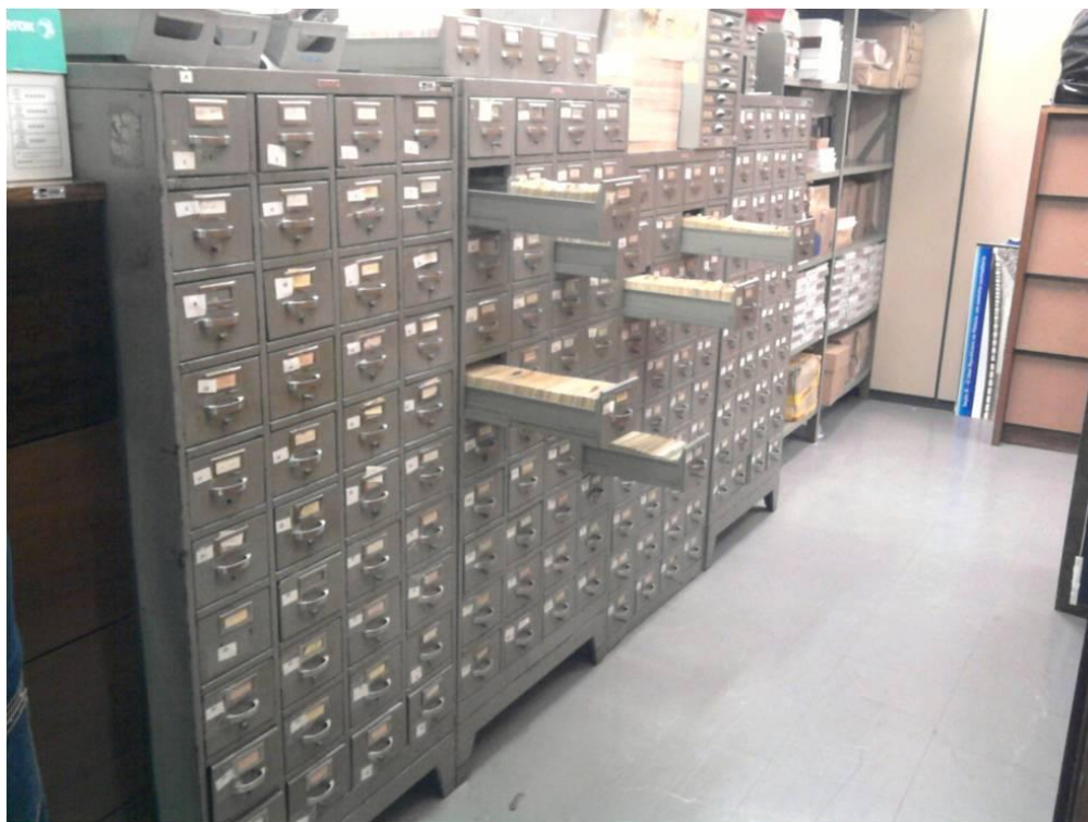
Figura 2 – Catálogo de legislação

Em 1996, o catálogo já possuía um total de duzentas mil fichas principais e cerca de um milhão de fichas com o desdobramento da ficha matriz. Tais números e a precariedade da organização desses dados impossibilitava uma rápida recuperação das informações. As figuras 2 e 3 apresentam o catálogo de fichas.