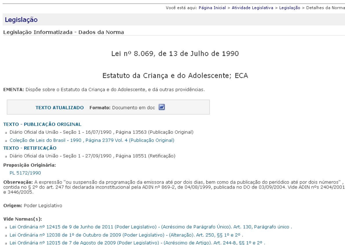
Figura 4 – Tela principal de uma norma jurídica no LEGIN

As modificações permitiram maior visibilidade das normas publicadas no LEGIN nos buscadores da Internet . No Google ao se digitar uma norma no buscador (ex.: lei nº 8112), aparecem referências para o Portal da Câmara, o que não acontecia anteriormente. É importante destacar que a página de Legislação do Portal da Câmara dos Deputados apresenta alguns diferenciais em relação aos demais sistemas de busca de legislação, como, por exemplo, a apresentação do link para a proposição que originou tal norma e toda sua tramitação na Câmara dos Deputados. Além disso a base de dados de Legislação Federal compreende também a legislação do Império (1808-1899), cujo tratamento é de responsabilidade da Seção de Obras Raras e Coleções Especiais da Coordenação de Biblioteca. A figura 4 apresenta a tela principal de uma norma jurídica no LEGIN.