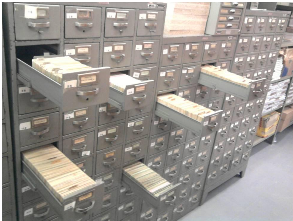
Figura 3 – Catálogo de legislação

Em outubro de 2000, iniciou-se o processo de digitação e informatização dos dados do Catálogo de Legislação Brasileira. A primeira etapa foi a digitação das fichas, com o intuito de agilizar a inserção dos dados no sistema. A digitação foi realizada em editores de texto. Para agilizar esse processo foi contratada uma empresa para digitação das fichas contando com 5 (cinco) digitadores, a revisão e indexação dos dados coube aos servidores da SELEB. No total foram digitados 2.230 lotes, perfazendo um total de 111.500 atos. Cada digitador processou uma média de dois lotes/dia e essa atividade foi concluída em 181 dias.